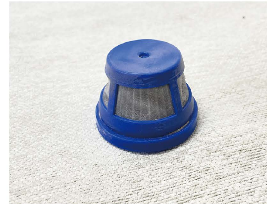
使用後のフィルターのイメージ

03 掃除をはじめて2週間が経過したら、1回分の調査は終了です フィルターをはずして返送する準備をしてください * フィルター部分は青色の2つのパーツに分かれますが両方とも返送してください