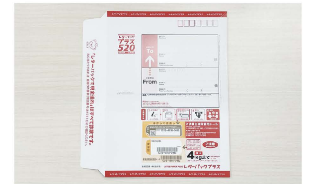
下記の返送先まで郵送をお願いします 注意：ポストには投函できません