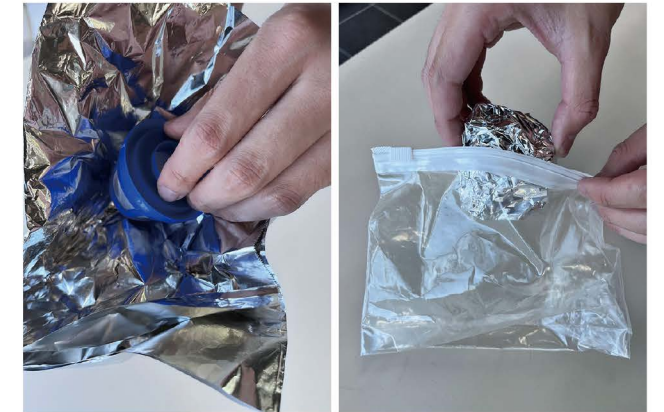
アルミホイルに包んでチャック付きの袋に入れる

04 調査の終了後、掃除をした場所に関するアンケートに回答し、フィルターと一緒に同梱の「レターパックプラス」に入れて郵送してください