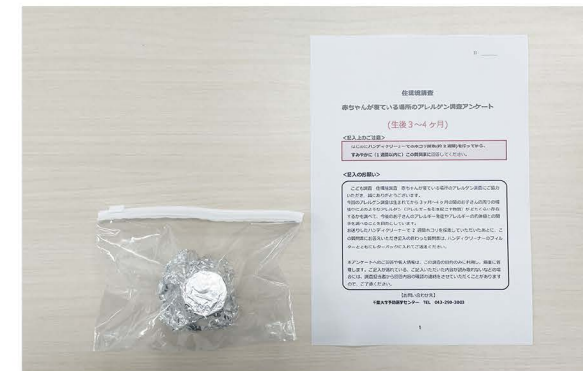
レターパックプラスに入れるもの

04 調査の終了後、掃除をした場所に関するアンケートに回答し、フィルターと一緒に同梱の「レターパックプラス」に入れて郵送してください