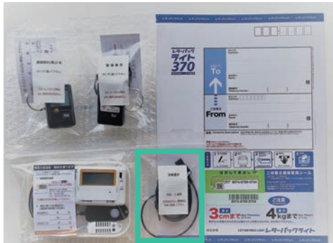
▲お申し込みいただいた方のみ

3つ（活動量ありは4つ）の器具・アンケート冊子を「返送用レターパック」に入れて返送します