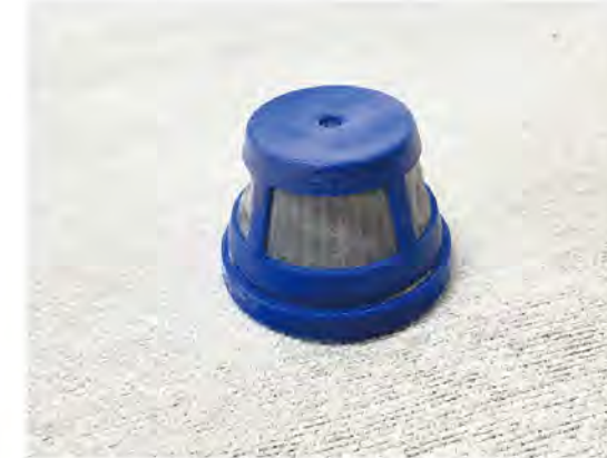
使用後のフィルターのイメージ