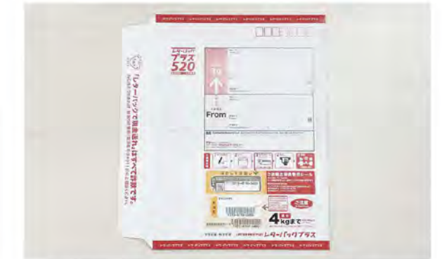
下記の返送先まで郵送をお願いします 注意：ポストには投函できません