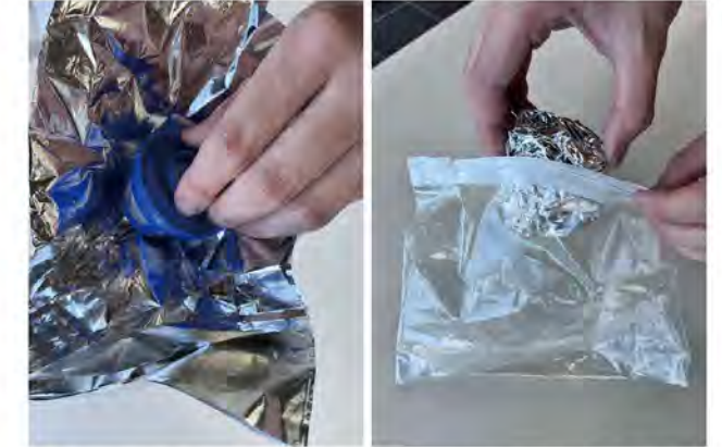
アルミホイルに包んでチャック付きの袋に入れる