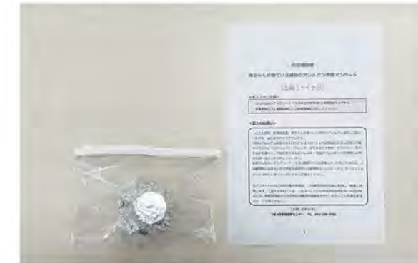
レターパックプラスに入れるもの